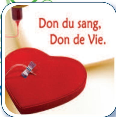
Clinique de sang du maire p. 3