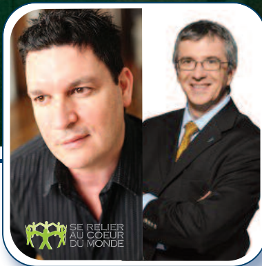
Soirées-conférences p. 9