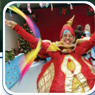
Noël 2015 p. 8