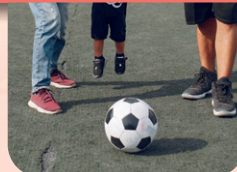
JEUDI 7 MARS Journée sportive à Saint-Césaire

0$ Notez que les activités sont GRATUITES et EXCLUSIVES aux résidents des municipalités participantes. Une preuve de résidence vous sera demandée.