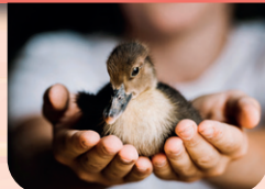
MERCREDI 6 MARS Journée poils et plumes à l'Ange-Gardien