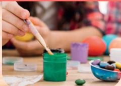
MARDI 5 MARS Journée artistique à Saint-Paul-d'Abbotsford